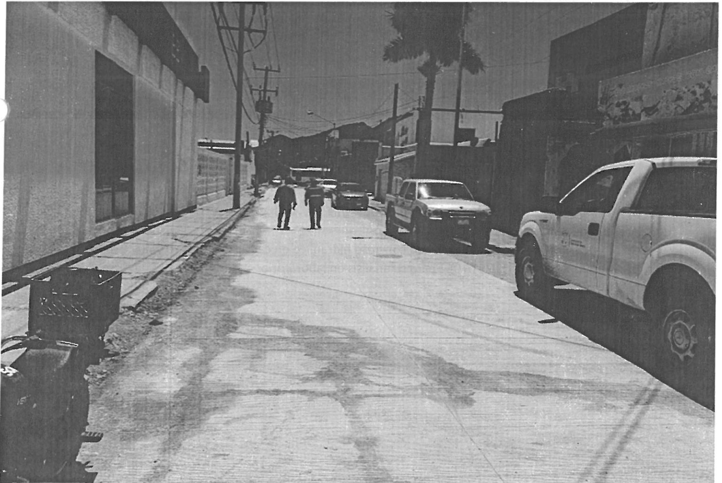
Vista panorámica del sitio de la obra.