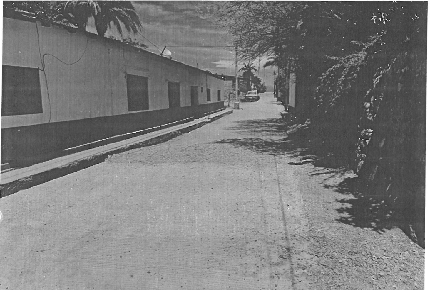
Vista panorámica del sitio de la obra.